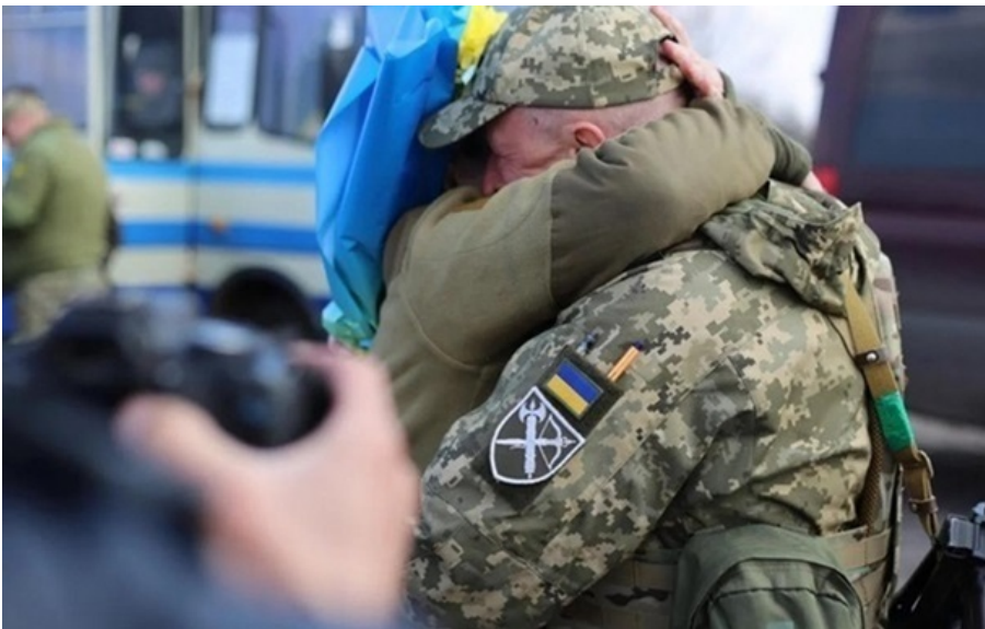
Готується новий обмін полоненими до кінця наступного тижня

Керівник Офісу президента Кирило Буданов очікує на новий етап обміну полоненими до кінця наступного тижня.