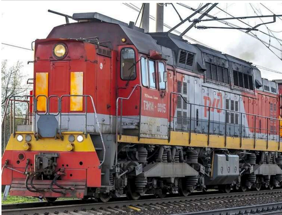
Залізниця РФ у вогні: партизани «АТЕШ» знищили тепловоз у Ростовській області

Агенти «АТЕШ» провели чергову успішну диверсію на залізниці РФ. У Ростовській області вони знищили тепловоз, який не підлягає відновленню.