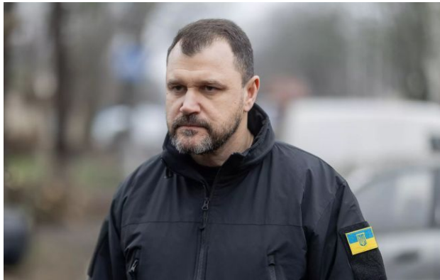
Фото: Ігор Клименко, міністр внутрішніх прав (mvs.gov.ua)

Українських поліцейських почнуть тренувати на полігонах - додаткових інструкторів для цього відбирають з цього тижня.