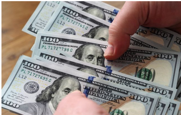
Фото: НАБУ викрило працівників СБУ на хабарі в 110 тисяч доларів

Обирайте перевірене - додайте РБК-Україна до улюблених джерел у Google