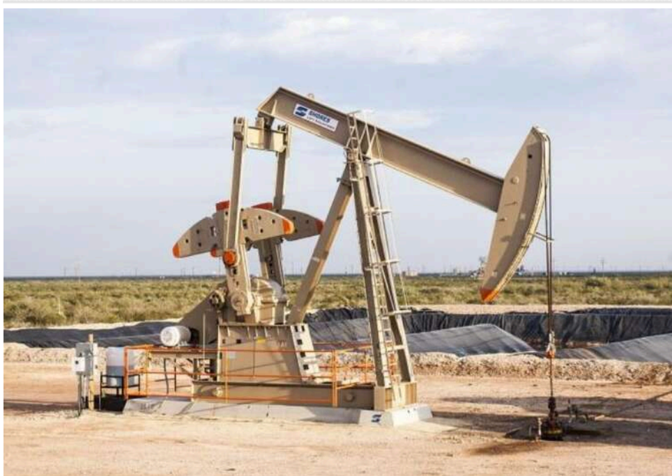
Goldman Sachs: Ціна нафти Brent у разі кризи може зрости до 120 доларів за барель