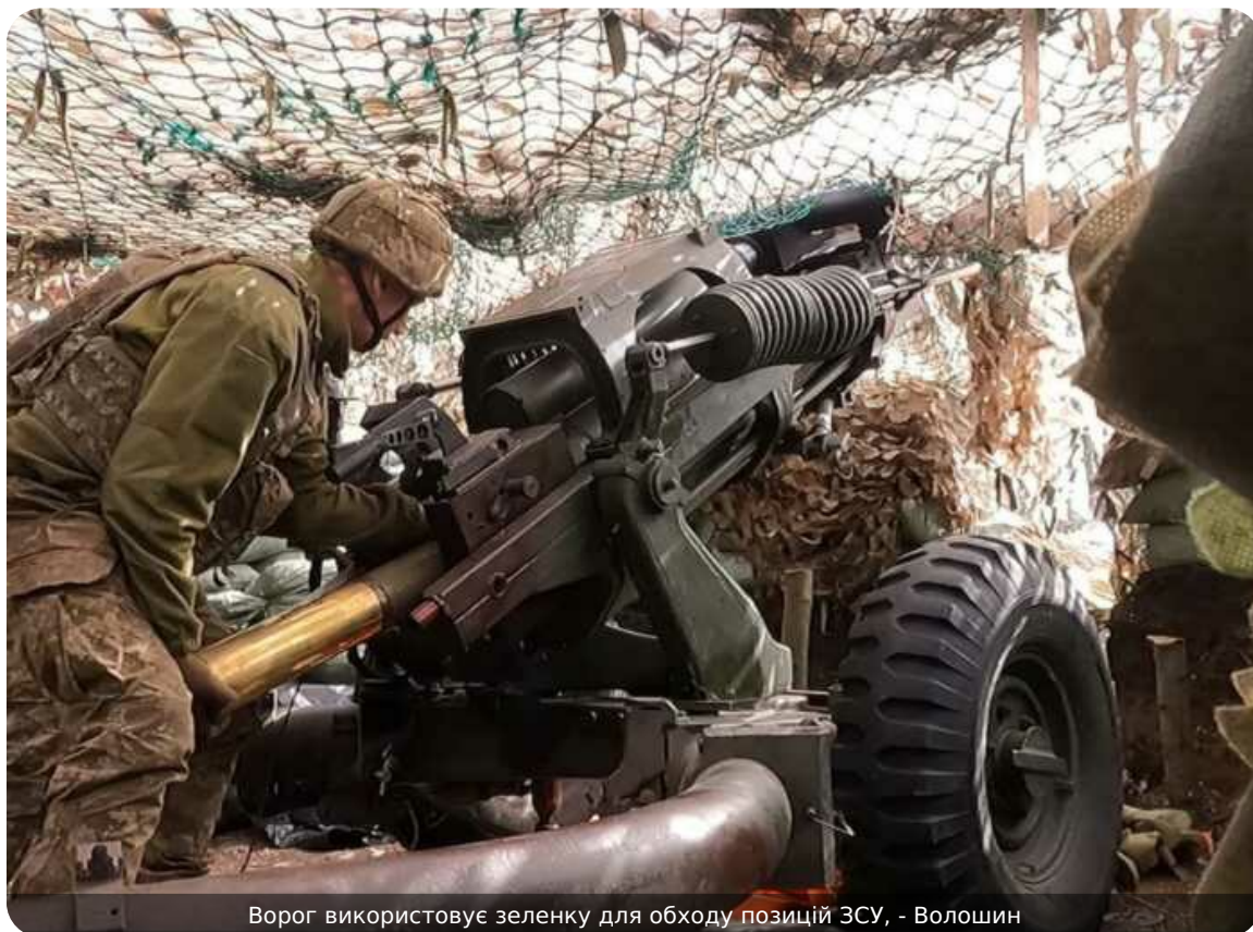
Ворог використовує зеленку для обходу позицій ЗСУ, - Волошин

На південному напрямку російські війська намагаються скористатися лісною місцевістю для просування вглиб українських позицій, зокрема поблизу Великомихайлівського лісу. Водночас Сили оборони активізують пошуково-ударні операції й утримують ворога.