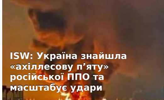
ISW: Україна знайшла «ахіллесову п'яту» російської ППО та масштабує удари