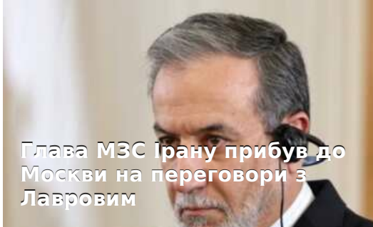
Глава МЗС Ірану прибув до Москви на переговори з Лавровим