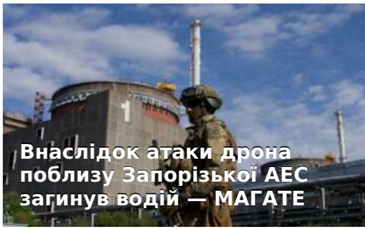
Внаслідок атаки дрона поблизу Запорізької АЕС загинув водій — МАГАТЕ