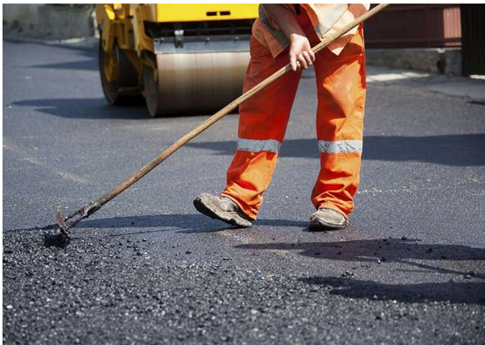
Асфальт на дев'ять мільярдів: кожна четверта гривня у «Прозорро» пішла на дороги, але лише «на папері»

З 19 по 25 квітня в системі «Прозорро» оприлюднено 58 тис. повідомлень про закупівлі на 36,47 млрд грн.