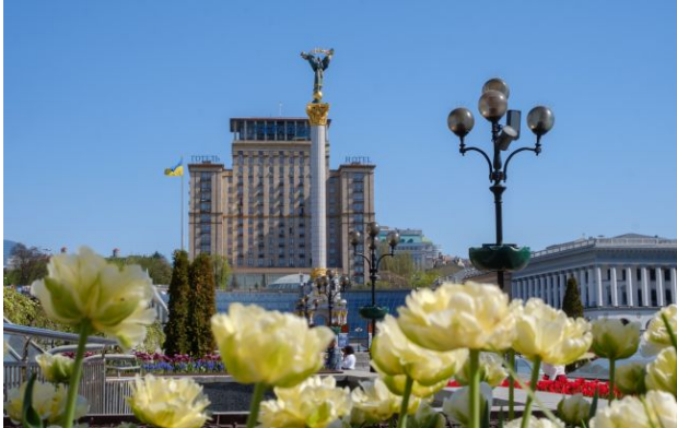
Потепління в Україні - бути

Після дощів і штормових поривів вітру в Україну повертаються заморозки. Проте холод не вічний - синоптики вже бачать тенденції до покращення ситуації та потепління.