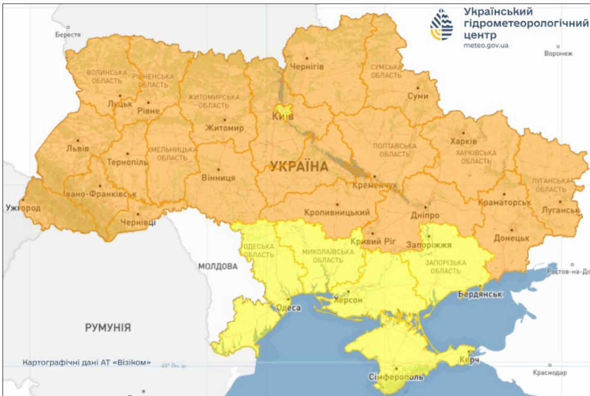
Заморозки в Україні вночі 28, 29 та 30 квітня (карта: facebook.com/UkrHMC )

– Щодо температурних значень, як я вже говорив, вночі в Україні - крім узбережжя морів та Криму - ми очікуємо в повітрі заморозки 0-3 градуси.