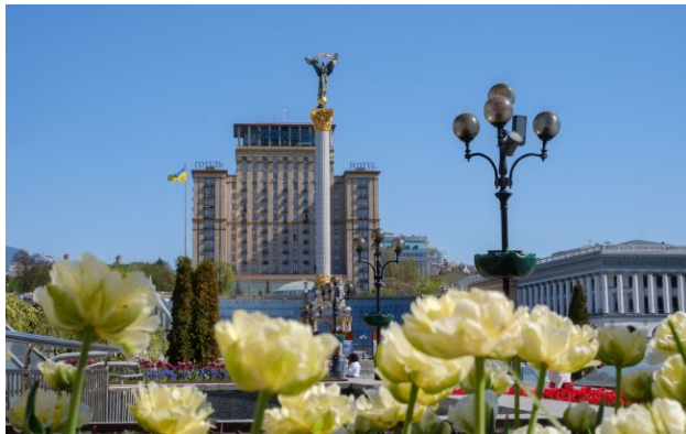
Потепління в Україні - бути

Після дощів і штормових поривів вітру в Україну повертаються заморозки. Проте холод не вічний - синоптики вже бачать тенденції до покращення ситуації та потепління.