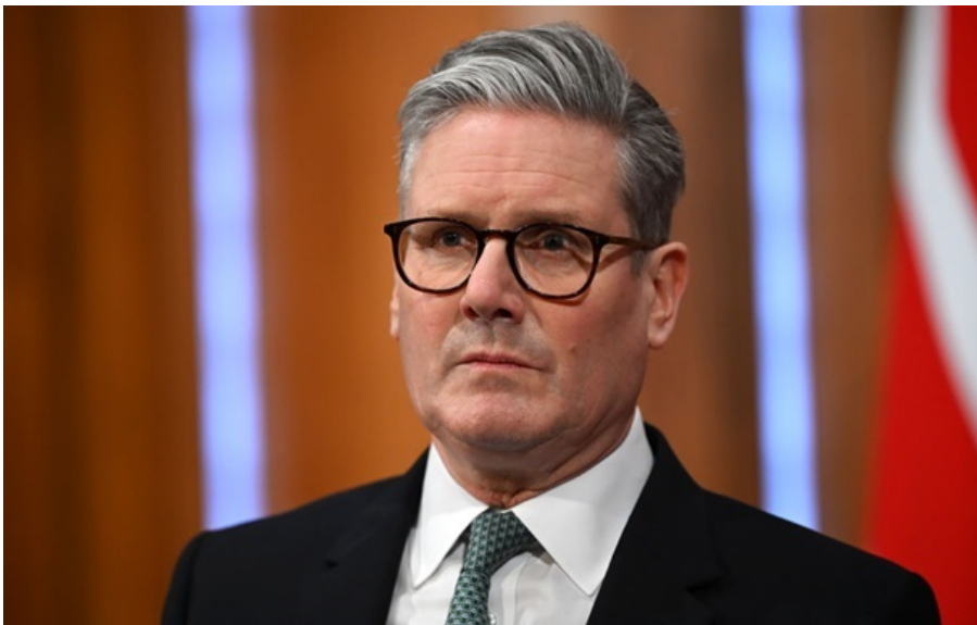
Прем'єр Британії Кір Стармер

Британія відправить свій контингент на українську територію для забезпечення майбутнього режиму припинення вогню.