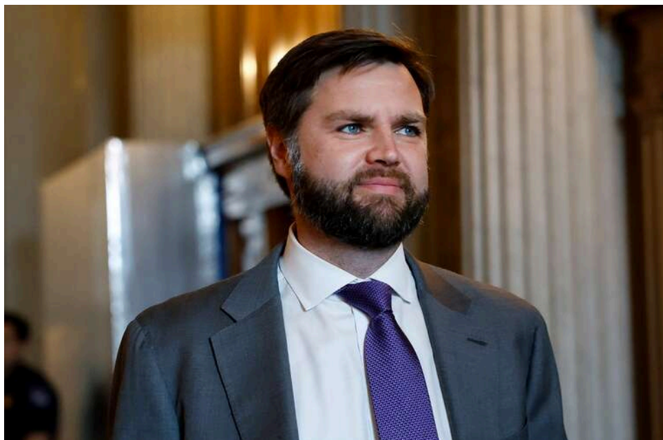
Уран, гроші та Ормузька протока: NYT назвала головні причини відсутності компромісу між США та Іраном

The New York Times підтверджує дані Axios: основними розбіжностями на переговорах між Іраном і США стали питання Ормузької протоки та збагачення урану.