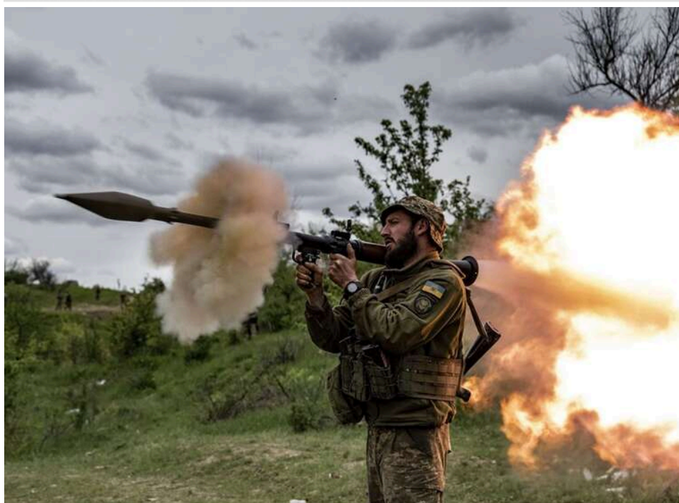
Ворог готує «лобові» штурми: офіцер НГУ попередив про концентрацію російської піхоти на передовій

Останні дії росіян на фронті свідчать про те, що вони готуються до поновлення наступальних дій. Утім плани ворога відомі Силам Оборони України.