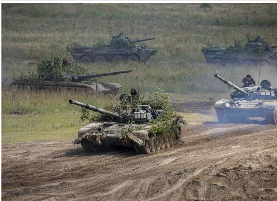
Ситуація на фронті: зафіксовано 76 атак від початку доби, Покровський напрямок залишається найскладнішим

Від початку доби росіяни 76 атакували позиції українських захисників на фронті.