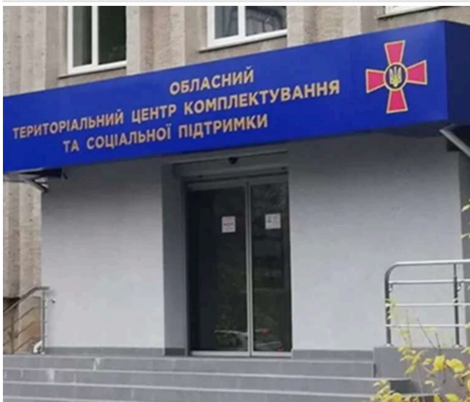
«Судимість знята»: В Обухівському ТЦК прокоментували призначення керівника, якого звинуватили в корупції

Обухівський військкомат спростував звинувачення в тому, що третім відділом Обухівського РТЦК керує людина зі судимістю за корупцію: у мережі циркулює інформація про це, але вона подається без повного контексту.