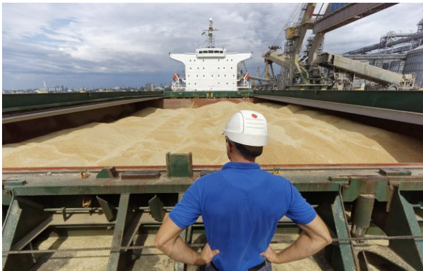
Фото: до Ізраїлю наближається друге судно з зерном

До ізраїльського порту наближається друге судно з краденою українською пшеницею. Україна вже попередила про можливі наслідки, якщо вантаж не відхилить.