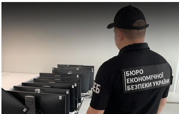
Фото: БЕБ розкрило схему, якою користувалися 200 компаній (facebook.com/ESBU.GOV.UA)

Бюро економічної безпеки викрило масштабний "конвертаційний центр", який діяв щонайменше з 2020 року і обслуговував сотні компаній по всій Україні.