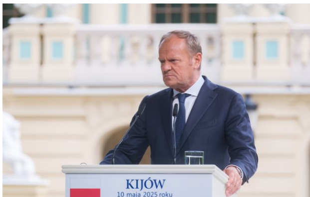
Фото: прем'єр-міністр Польщі Дональд Туск

Варшава планує створити власний масштабний флот дронів, спираючись на те, що Україна вже довела в реальних боях.