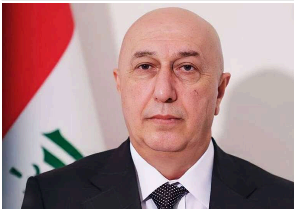
Ірак обрав президента: Нізар Аміді здобув нищівну перемогу в парламенті

Іракський парламент обрав нового президента: Нізар Аміді завоював більшість голосів.