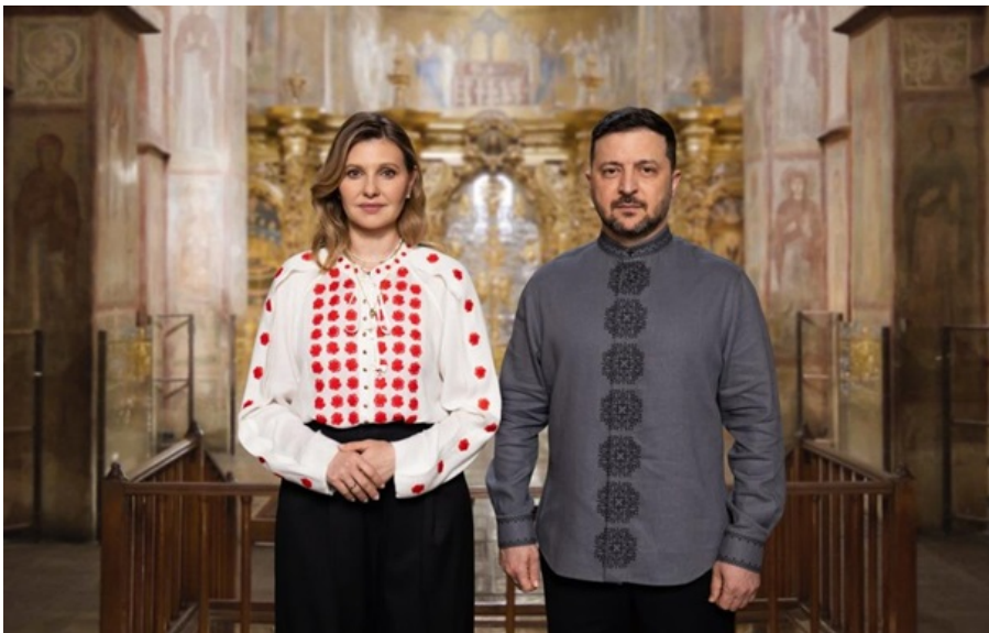
Володимир та Олена Зеленські привітали українців із Великоднем

У зверненні президентське подружжя наголосило на силі віри та єдності українців у боротьбі за мир та збереження традицій.