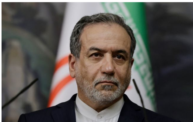
Фото: Міністр закордонних справ Ірану Аббас Арагчі

Міністр закордонних справ Ірану Аббас Арагчі прибув до Москви. На порядку денному ситуація на Близькому Сході та стан переговорів Тегерана з Вашингтоном.