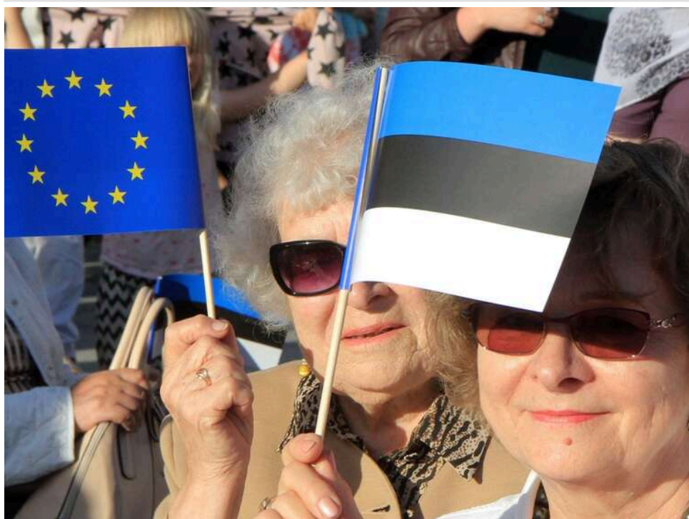
«Зробити ціну максимальною»: Естонія закликає ЄС до жорсткіших покарань для російських диверсантів

Естонія закликала Європу суворіше карати диверсантів, які діють в інтересах Росії, – FT.