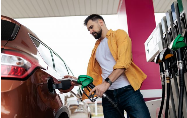
Фото: ціни на пальне тримаються, але різниця між мережами є

Більшість автозаправних станцій в Україні залишили ціни без змін після вихідних. Водночас у держмережі зафіксовано точкове подорожчання.