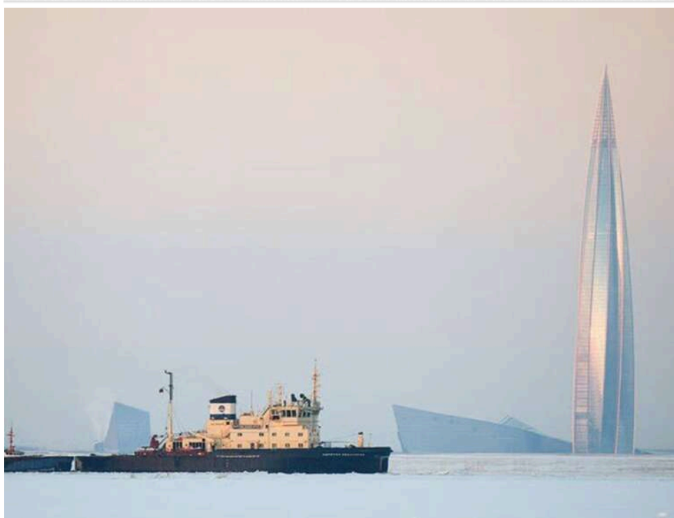
Нафтовий «затор» у Фінській затоці: десятки танкерів «тіньового флоту» РФ застрягли біля берегів Естонії та Фінляндії

«Тіньовий флот» застряг у Балтійському морі: Фінська затока перетворюється на нову зону небезпеки.