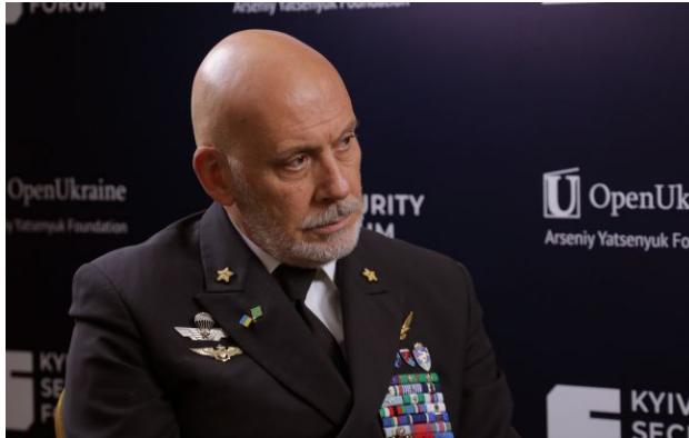
Фото: голова Військового комітету Альянсу адмірал Джузеппе Каво Драгоне

Росія щомісяця втрачає в Україні більше людей, ніж СРСР за все десятиліття афганської кампанії.