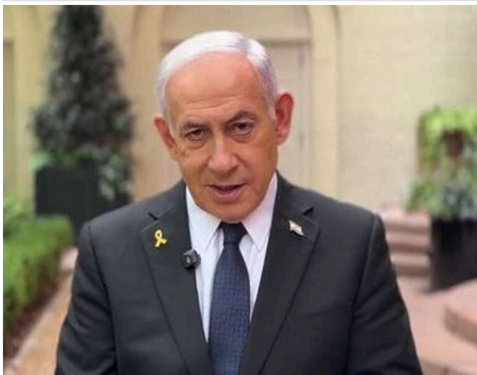
Справа «Флотилії Сумуд»: Нетаньягу та ще 34 чиновникам Ізраїлю загрожує довічне ув'язнення в Туреччині