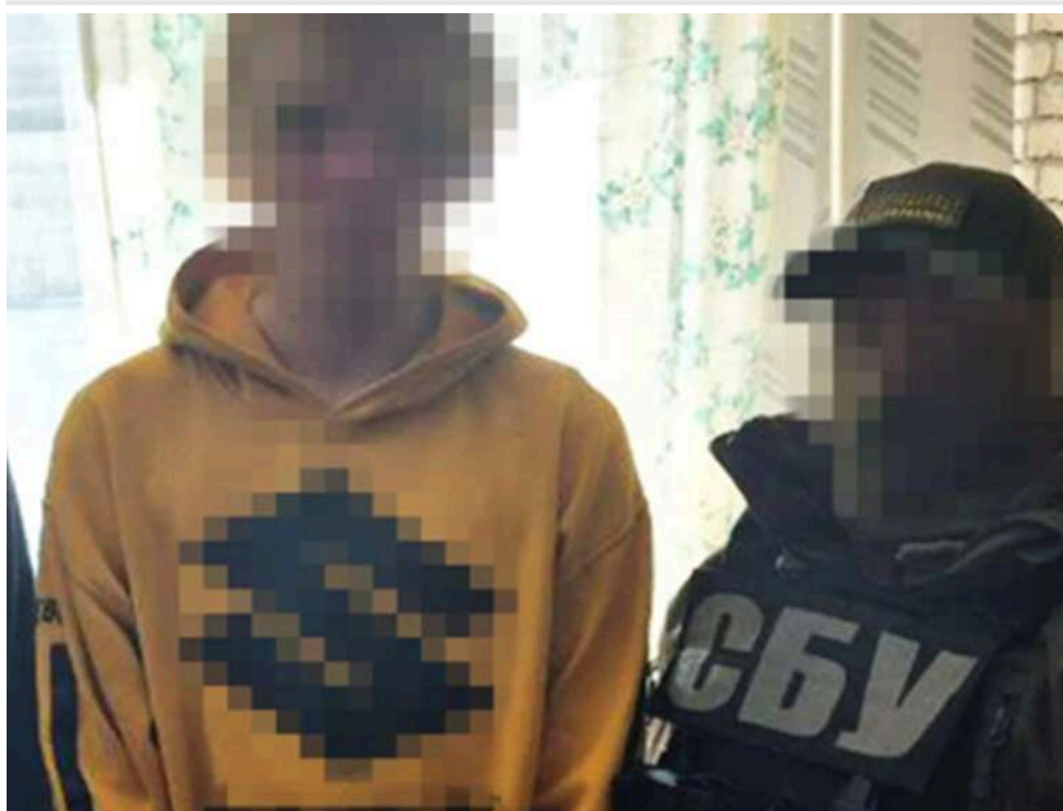
Довічне замість "легких грошей": у Черкасах затримали студента, який готував удари РФ по енергооб'єктах