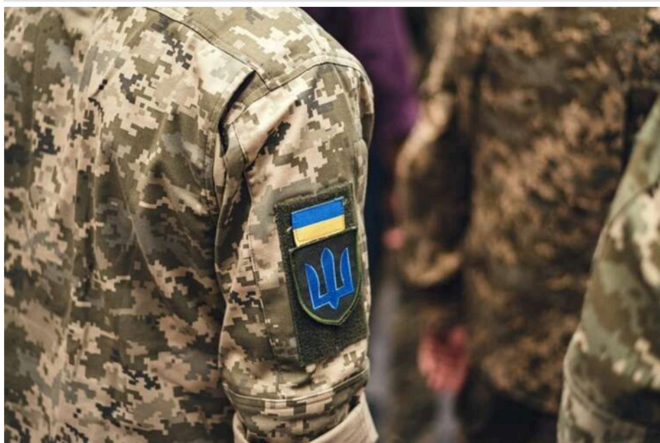
В Яворівському ТЦК на Львівщині стався напад на військовослужбовців: двох осіб затримано

У ТЦК напали на військових просто на місці, повідомляє Львівський обласний військкомат.