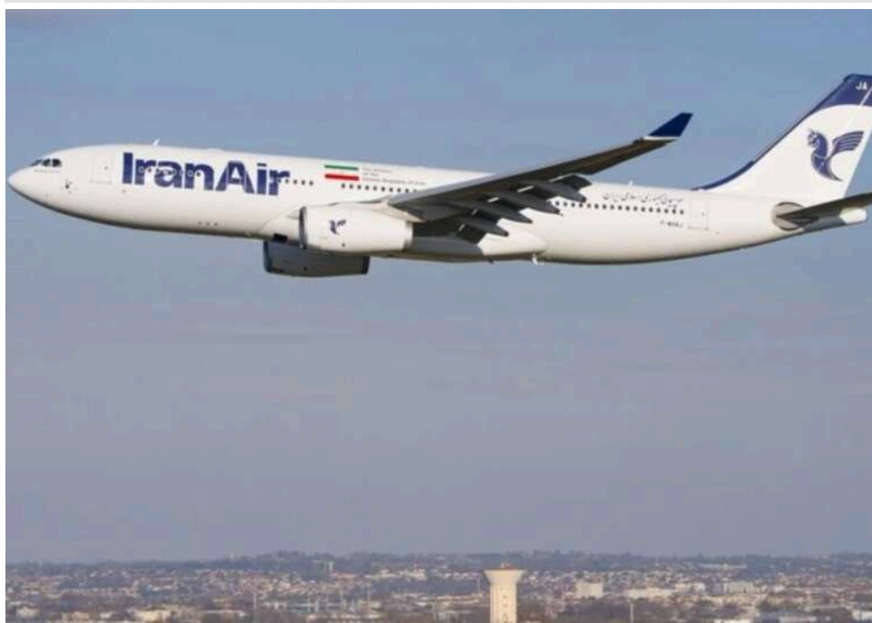
Іран частково відкрив повітряний простір для цивільної авіації

Іран уперше з 28 лютого частково відкрив повітряний простір для цивільної авіації.