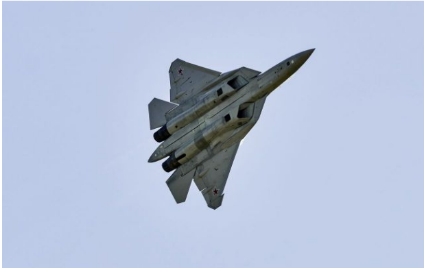
Фото: у ГУР розкрили характеристики нової крилатої ракети РФ "Ковьор"

Російські війська почали використовувати нову крилату ракету "Ковьор", яка у якості бойової частини використовує 250-кілограмову авіабомбу.