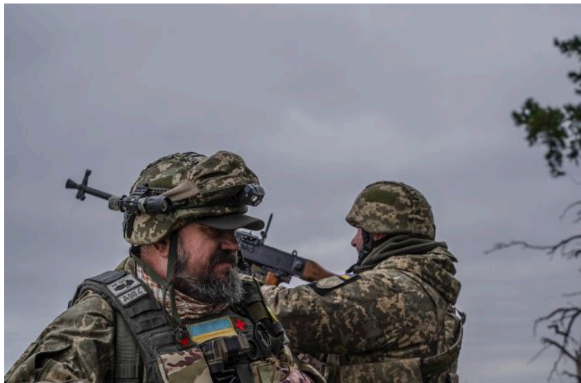
Ілюстративне фото: сили ППО атакували 60 "Шахедами"