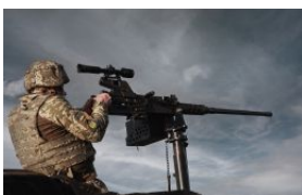
Табуни "Шахедів" над