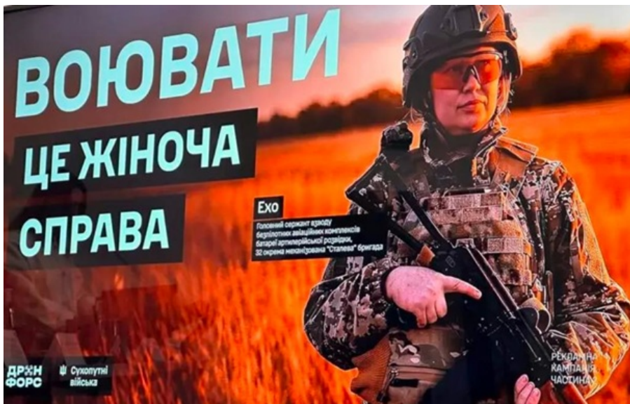
В Україні немає примусової мобілізації жінок

У відомстві заповнюють, що всі помилки вже виправляють і кожен випадок буде врегульовано.