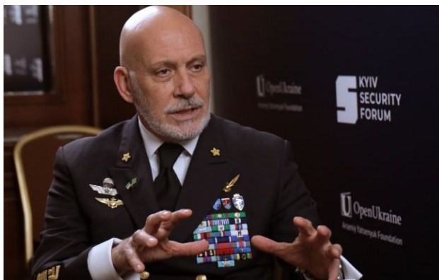
Фото: голова Військового комітету НАТО адмірал Джузеппе Каво Драгоне

У НАТО назвали Росію загрозою номер один і попередили: Кремль планує повернути контроль над землями, якими він володів до розпаду Радянського Союзу.