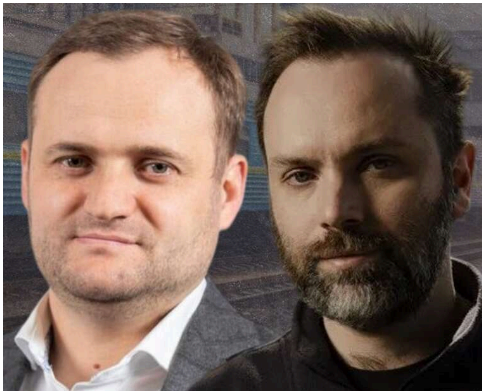
Збої в системі та стабільні збори: Як керівництво "Укрзалізниці" отримує сотні тисяч, поки сервіс та умови праці деградують

Під приводом «соціальних внесків» із зарплати залізничників утримують частину коштів.