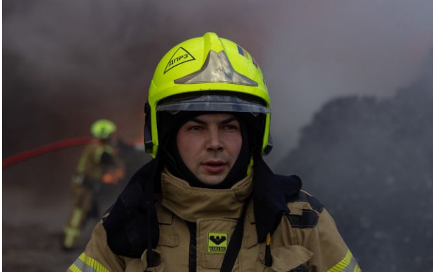
Фото: співробітники служб та комунальників працювали на місцях усю ніч

Одеса в ніч на 27 квітня пережила чергову масовану атаку РФ дронами. У місті внаслідок пошкоджені багатопверхівки, готель і є постраждалі.