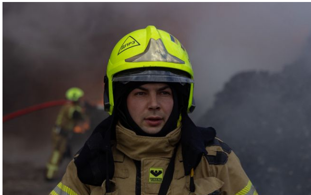
Фото: співробітники служб та комунальників працювали на місцях усю ніч

Одесса в ніч на 27 квітня пережила чергову масовану атаку РФ дронами. У місті внаслідок пошкоджені багатопверхівки, готель і є постраждалі.