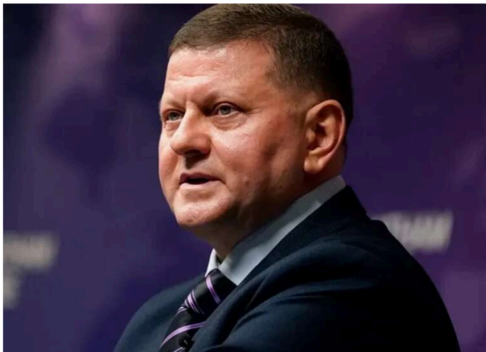
П'ять сценаріїв для України: Валерій Залужний розібрав варіанти завершення війни та роль союзників

Посол України у Великій Британії та колишній Головнокомандувач ЗСУ Валерій Залужний розглянув п'ять теоретичних сценаріїв завершення війни.