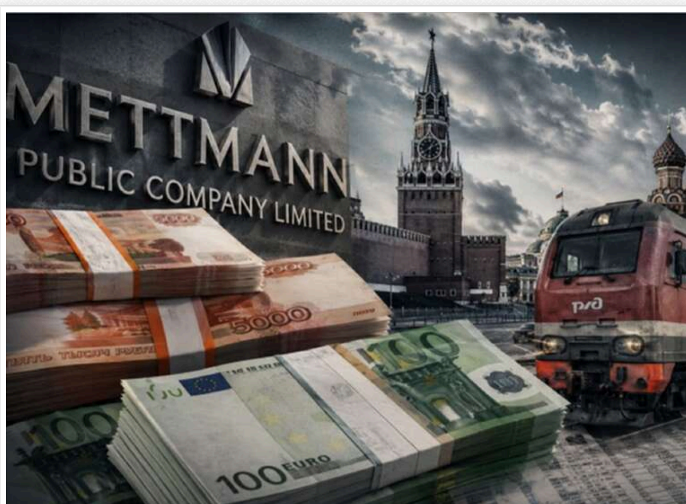
Mettmann Public Company Limited: чому російська «пральня» успішно продовжує відмивати санкційні гроші

Кіпрська Mettmann Public Company Limited – типовий офшор «другого ешелону», який довгий час залишаєся поза фокусом великих міжнародних розслідувань. Але з 2024–2026 років вона почала сливатися в ланцюгах, пов'язаних з обходом антиросійських санкцій – через боргові інструменти, нерухомість і посередницькі структури в ЄС. Формально Mettmann – інвестиційна компанія, фактично ж – це вузол перерозподілу капіталу, де гроші втрачають походження швидше, ніж їх встигають відстежити регулятори.