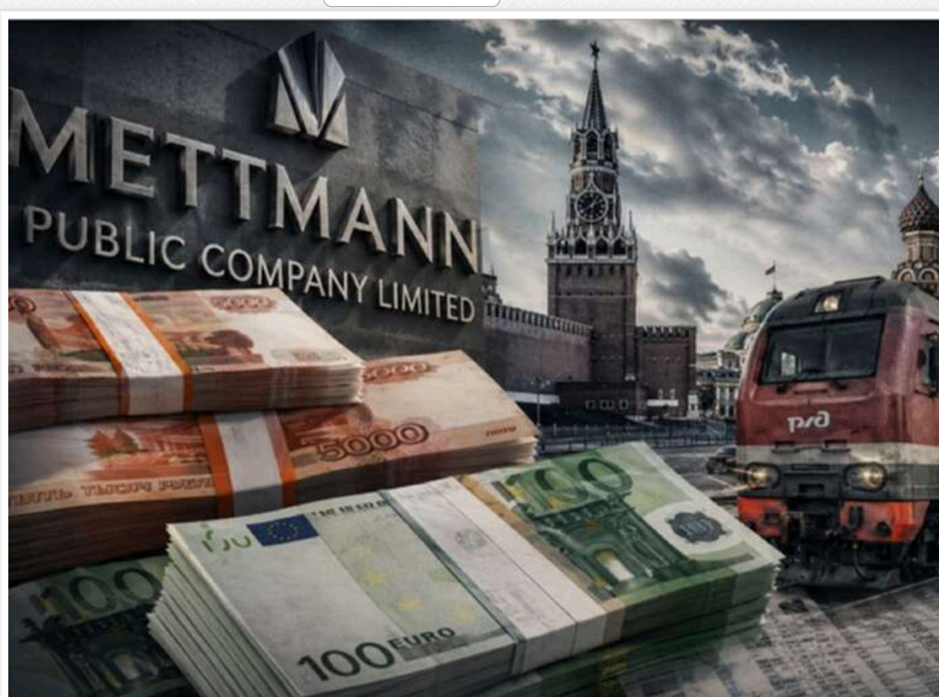
Mettmann Public Company Limited: чому російська «пральня» успішно продовжує відмивати санкційні гроші

Читати на англійськ Read in English Додати як бажане джерело в Google