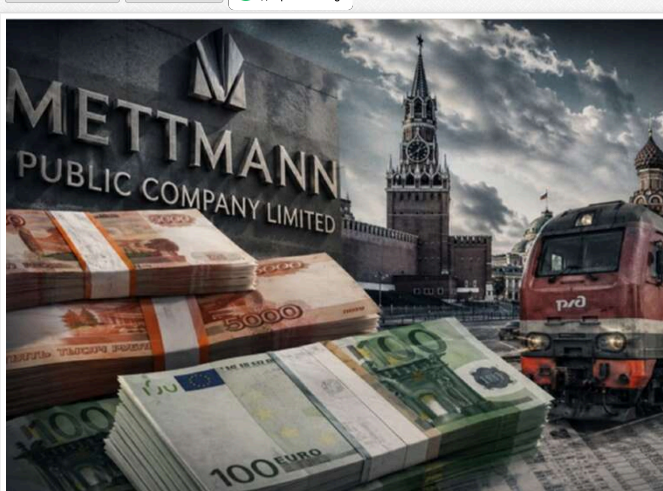
Mettmann Public Company Limited: чому російська «пральня» успішно продовжує відмивати санкційні гроші

Читати на англійській Read in English Додати це бажане джерело в Google