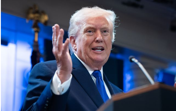
Фото: Дональд Трамп (Getty Images)

Іран представив США нову пропозицію про відновлення Ормузької протоки і припинення війни. При цьому ядерні переговори Тегеран пропонує відкласти на пізніший етап.