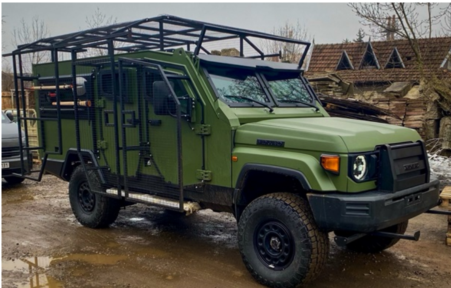
Покращена версія MEDIGUARD