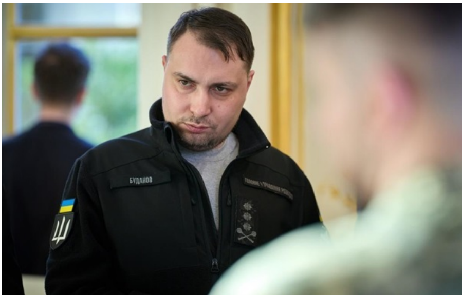
Керівник Офісу президента Кирило Буданов

Перед наступним раундом тристоронніх переговорів українські делегати планують обговорювати важливі уроки історії для правильних висновків.