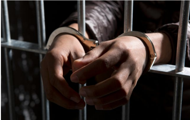
Фото: станом на п'ятницю чоловіка ще не відправили до США (Getty Images)

Уряд Італії ухвалив рішення про екстрадицію громадянина Китаю, якого розшукують США за звинуваченням у хакерських атаках.