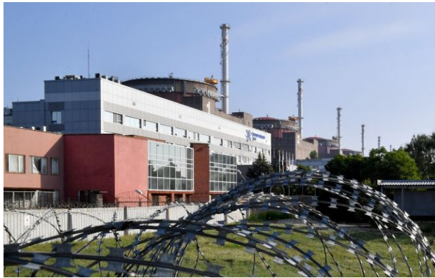
Фото: кожен подібний інцидент підвищує ризик для ядерної та радіаційної безпеки

У неділю, 26 квітня, Запорізька АЕС вчергове перебувала у блекауті. Наразі це вже був 15-й блекаут з початку окупації у 2022 році.