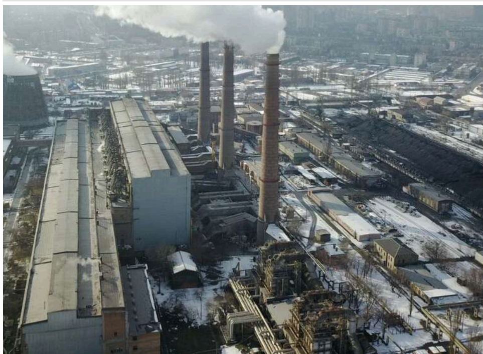
«Виїжджайте до 2027 року»: у Дарницькому районі Києва викрили ворожу провокацію про відключення води та тепла

У Дарницькому районі Києва на будинках, що обслуговуються ТЕЦ-4, з'явилися провокативні відозви, написані, нібито, від імені ЖЕКів, що управляються місцевою Керуючою компанією. У них мешканцям радять виїздити із власних квартир восени 2026 року, буцімто, через проблеми з опаленням та "неминуче відключення" холодного водопостачання й зупинку роботи каналізації. Фахівці розцінюють такі цибульки, як ІПСО ворога, й закликають не зважати на подібні "оголошення" - нині ж намагаються з'ясувати, хто був їхнім автором, і наскільки велику кількість будинків встигли обклеїти такими дописами.