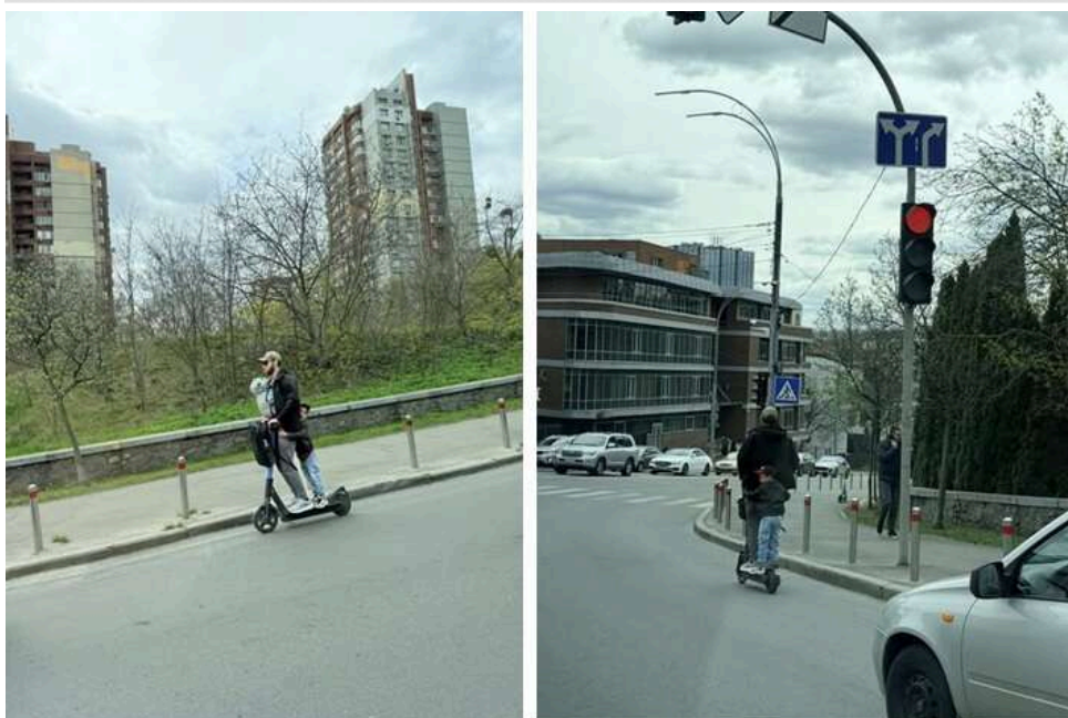
«Батько року» на Печерську: у Києві водій самоката віз двох дітей, тримаючи немовля на грудях

У Києві, здається, встановили батька року. У мережу виклали світлини, на яких водій електросамоката підвозив разом із собою ще двох дітлахів. Молодшого тримав, притиснувши до грудей, а старший хлопчик, років п'яти, щосили тримався за татові штани позаду. Світлини цілком справедливо викликали обурення в Мережі: адже чоловік не лише наразив на небезпеку "себе укоханого", а ще й ризикував власними дітлахами.