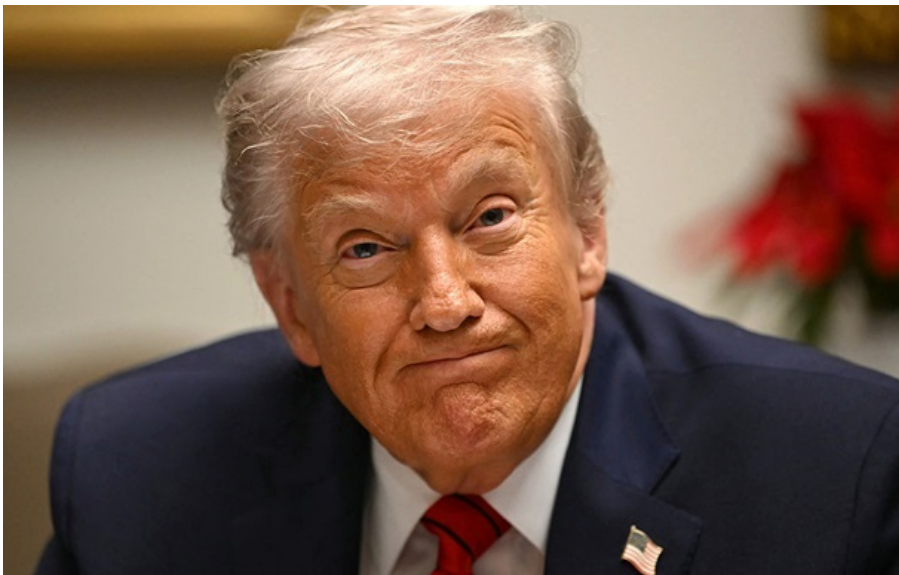
Президент США Дональд Трамп

Глава Білого дому вважає, що військові сили Ірану - наземні, повітряні і морські - були практично знищені.