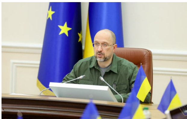
Фото: перший віцепрем'єр - міністр енергетики України Денис Шмигаль (kmu.gov.ua)

Для відновлення Нового безпечного конфайнменту на ЧАЕС після російської атаки розпочали збір коштів, загальна вартість робіт оцінюється у 500 млн євро.